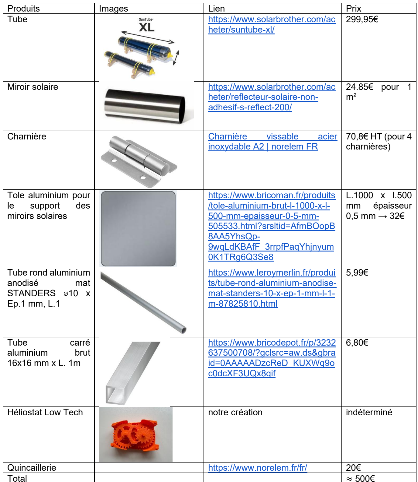
Tableau récapitulatif des composantes de notre solution finale

Après différentes recherches, nous avons choisis les différentes composantes disponibles dans le tableau suivant :