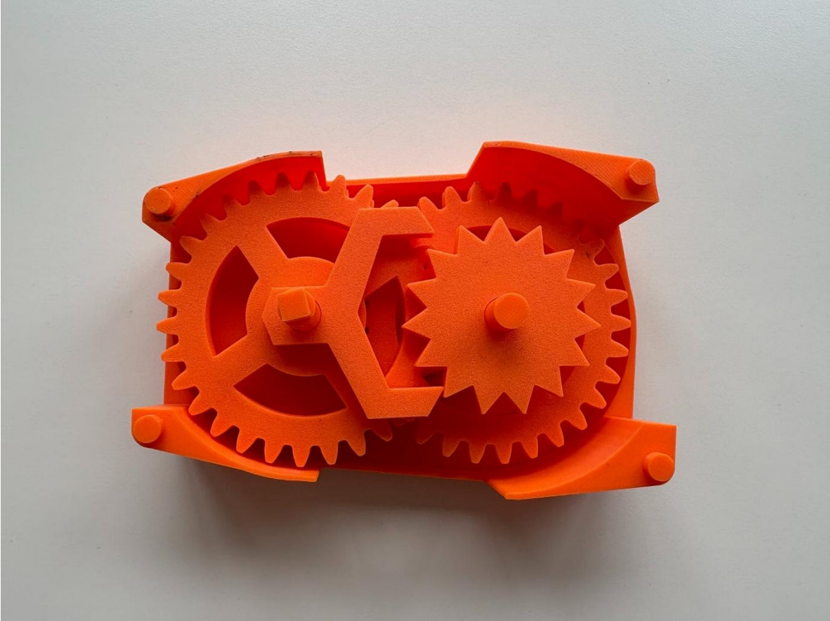
Image du mécanisme de positionnement en impression 3D vu du dessus